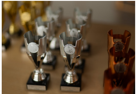
Pokale für die Meisterschaft