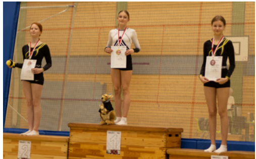
AK 13: Edda auf Platz 1