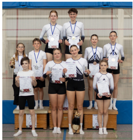
Trampolinteam Synchronwettkampf 2026

Es war ein erfolgreicher Wettkampftag und wir konnten wieder viele Medaillen und Pokale mit nach Hause nehmen, Erfahrungen sammeln und gemeinsam einen sportlichen Tag verbringen. Zwei Wettkämpfe folgen noch vor den Sommerferien. Den Mannschaftswettkampf am 13.09.26 richten wir in Göttingen in der THG Sporthalle aus – Zuschauer sind willkommen!