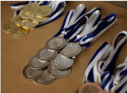
Medaillen für den Wettkampf